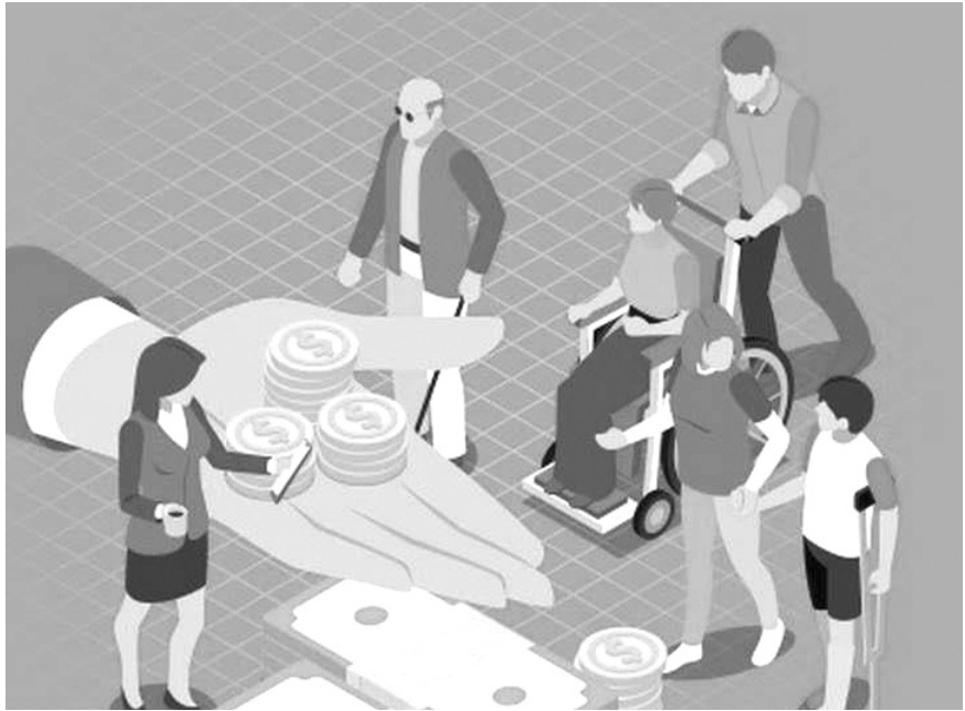
Hình minh họa.

Một triệu căn hộ nhà ở xã hội: Con số 1 triệu này thể hiện sự quyết tâm giải quyết vấn đề nhà ở cho người thu nhập thấp, công nhân, người lao động tại các đô thị lớn. Đây không chỉ là bảo đảm nhu cầu cơ bản mà còn là yếu tố quan trọng để ổn định cuộc sống, yên tâm lao động sản