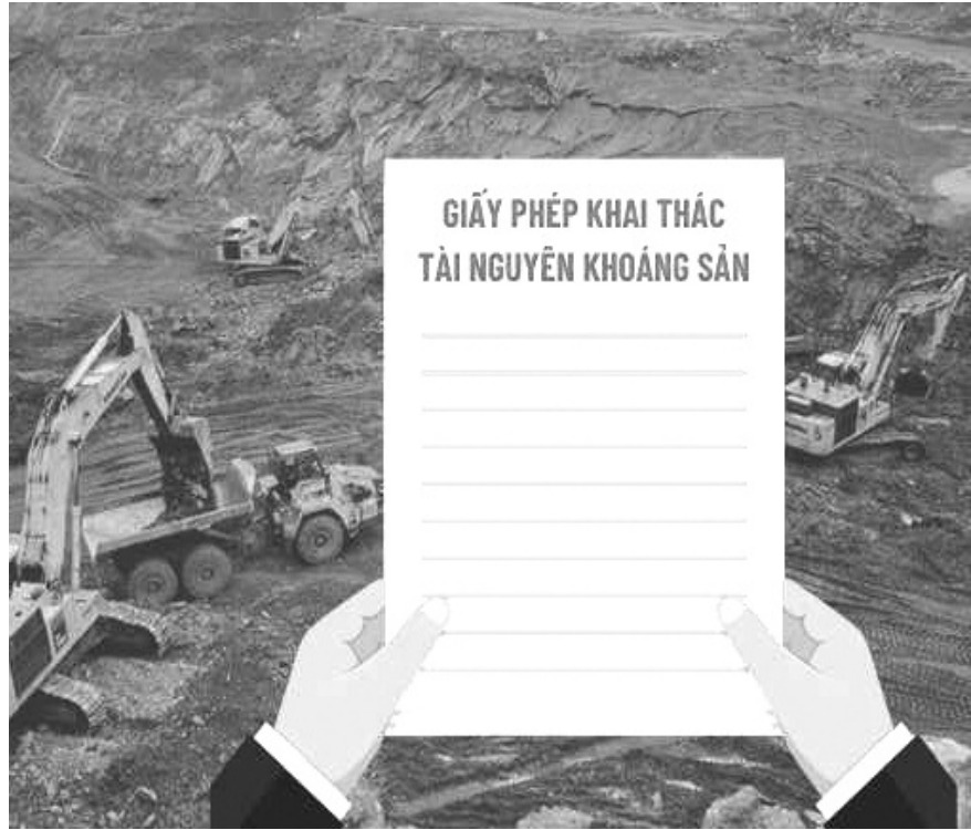
Hình minh họa.

Tài nguyên thiên nhiên là nguồn lực đặc biệt quan trọng, gắn liền với sự phát triển bền vững của quốc gia và lợi ích lâu dài của cộng đồng. Việc hình sự hóa hành vi vi phạm quy định về nghiên cứu, thăm dò, khai thác tài nguyên tại Điều 227 Bộ luật Hình sự năm 2015 thể hiện rõ quan điểm của Nhà nước trong việc tăng cường bảo vệ chế độ quản lý tài nguyên, bảo đảm trật tự quản lý kinh tế và phòng ngừa các hành vi xâm hại môi trường,