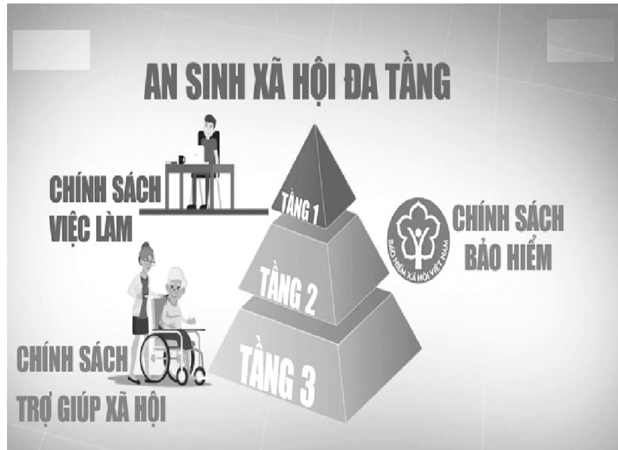
Hình minh họa.

Trách nhiệm vô điều kiện: Đây là cam kết đạo đức và pháp lý cao nhất. Mọi chính sách, chương