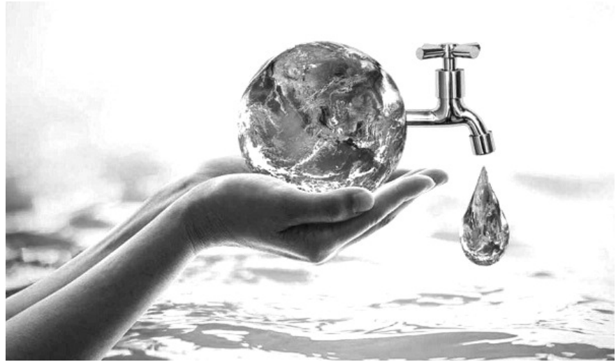
Hình minh họa.

Thứ ba , tham khảo và áp dụng nguyên tắc “không suy thoái thêm (non-deterioration principle)” của EU. Theo đó, Việt Nam có thể tham khảo kinh nghiệm của EU và sửa đổi, bổ sung Điều 8 Luật Tài nguyên nước năm 2023 để loại bỏ hoặc siết chặt các ngoại lệ mơ hồ như “trừ trường hợp pháp luật có quy định khác” tại khoản 5 về lấn, lấp sông và khoản 10 về xây dựng công trình trái quy hoạch, thay bằng quy định rõ ràng: mọi dự án mới phải chứng minh không gây suy thoái thêm (dựa trên đánh giá tác động toàn bộ lưu vực sông), đồng thời tăng cường giám sát trung ương đối với việc lập và điều chỉnh hành lang bảo vệ nguồn nước (Điều 23). Việc áp dụng nguyên tắc này sẽ giúp ngăn chặn tình trạng dự án thủy điện, khai thác cát, đô thị hóa ven sông tiếp tục gây sạt lở, ô nhiễm và suy thoái sinh thái,